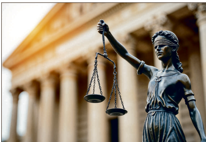
Iustitia als Symbol für Unparteilichkeit.

Wer an dieser verantwortungsvollen Tätigkeit als ehrenamtlicher Richter/ehrenamtliche Richterin interessiert ist, wird gebeten, sich bis zum 30. April 2025 an das Landratsamt Altenburger Land, Ehrenamtsbüro (siehe Kontaktkasten) zu wenden. Um die Bewerbung bearbeiten zu können, werden diese Angaben benötigt: Name, Vorname, Geburtsort, Geburtsdatum, Beruf und Anschrift.