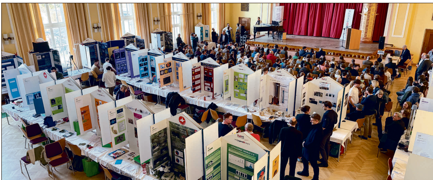
„Jugend forscht“ im Kulturhaus Rositz.