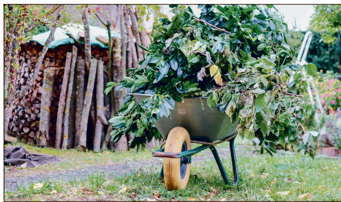
Schubkarre mit Grünschnitt.

Grünschnitt kann bei den Recyclinghöfen und der Kompostieranlage abgegeben werden