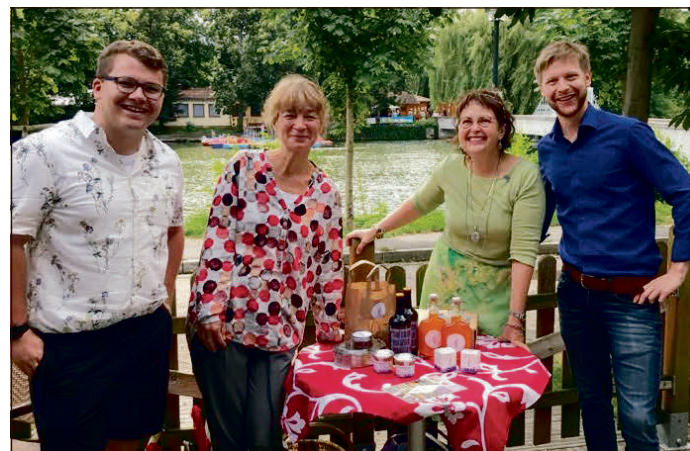
Aufbau eines regionalen Netzwerkes von Safran-Produzenten und Safran-Verarbeitern.