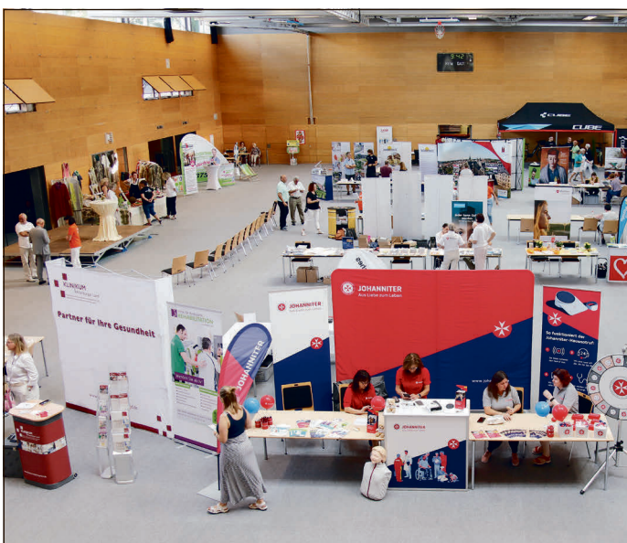
Seniorenmesse mit rund 30 Ausstellern im Goldenen Pflug 2023.

Auf der Seniorenmesse werden sich Unternehmen, Vereine