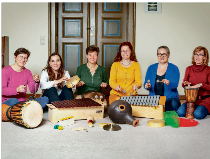
Musikpädagoginnen der Musikschule.

Die Kurs-Anmeldung erfolgt unter www.musikschule-altenburgerland.de/anmelden . Daraufhin meldet sich die jeweilige Kursleiterin, um einen ersten Schnuppertermin zu vereinbaren. Mit verbindlicher Teilnahme gibt es den Gebührenbescheid durch die Musikschulverwaltung. Fragen zu den Angeboten können telefonisch oder per E-Mail gestellt werden. Silvia Annecke, Musikschule Altenburger Land