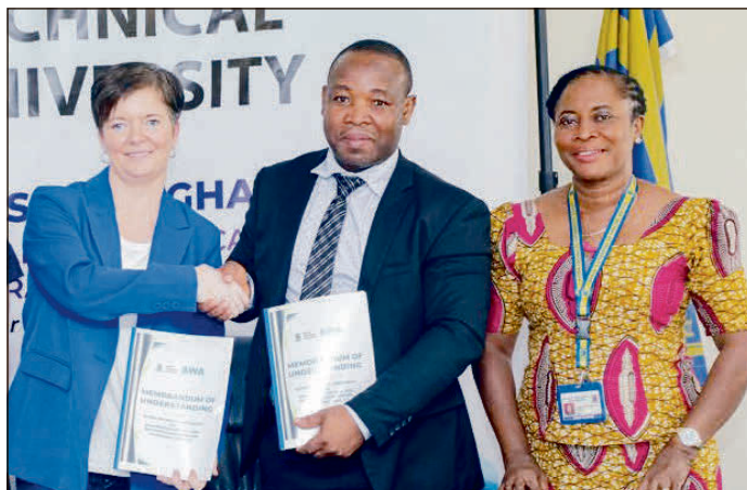
Digitale Qualifizierung ausländischer Fachkräfte in der Zerspanungs- und Automatisierungstechnik.