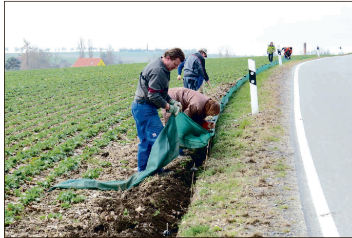
Aufbau einer mobilen Amphibienleiteinrichtung durch den Landschaftspflegeverband Altenburger Land e.V.

Bei der jährlichen Wanderung von den Überwinterungsquartieren zu den Laichgewässern lauern die größten Gefahren für die kleinen Tiere, da sie hierbei häufig verkehrsreiche Straßen überqueren müssen. Insbesondere in den ersten lauen Frühlingsnächten und bei regnerischem Wetter folgen die Tiere zu Hunderten ihrem Instinkt. „Wir bitten deshalb die Kraftfahrer, die an den Wanderstrecken aufgestellt